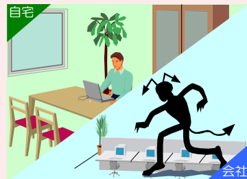
新型インフルエンザ対策